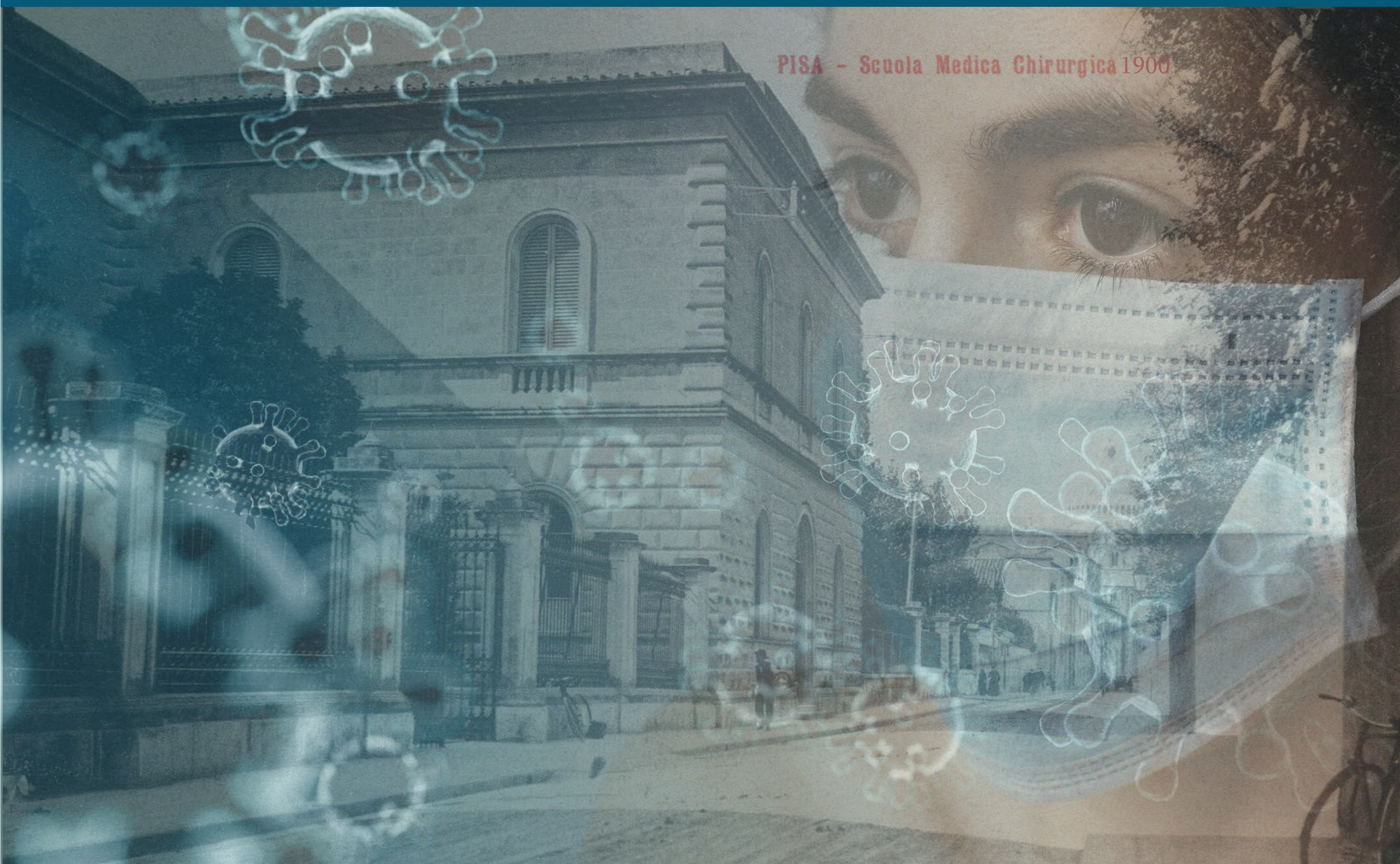
PISA - Scuola Medica Chirurgica 1900

DALLA EMERGENZA SANITARIA ALLA STABILIZZAZIONE FINANZIARIA DELLA SANITÀ PUBBLICA